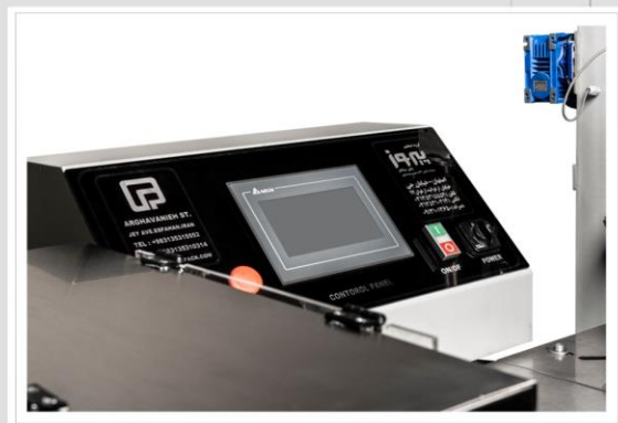
جلوه ای از تکریم مشتری و عرضه خدمت پایدار