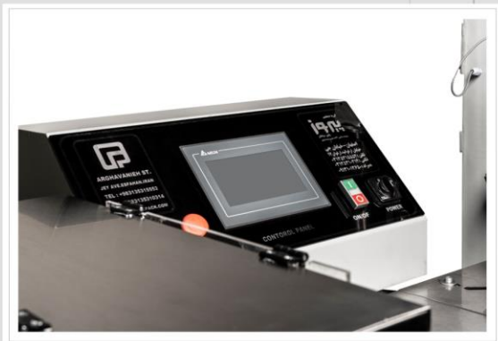
جلوه ای از تکریم مشتری و عرضه خدمت پایدار